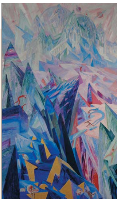
The path of genius , Wenzel Hablik

Avec les écrivains et leurs personnages dans cette section du livre, tu auras voyagé en Haïti, au Sénégal, en Chine, en Hongrie, en Belgique, en Italie, au Liban et en France.