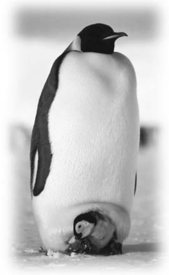
Patrick Piro Hors Série n° 12, avril 1993