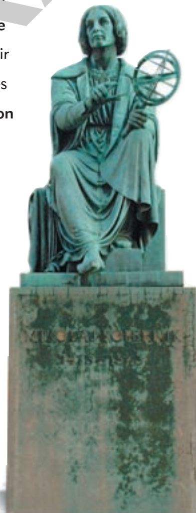
Statue de Nicolas Copernic, devant le Planétarium de Montréal.

Le livre de Copernic fut publié à Nuremberg au début de 1543. Le 23 mai de cette même année, le célèbre astronome mourut à Frauenburg, mais non sans avoir eu la satisfaction de tenir dans ses mains frémissantes le premier exemplaire de son œuvre. Cette publication a marqué un tournant historique dans l'histoire de la pensée scientifique.